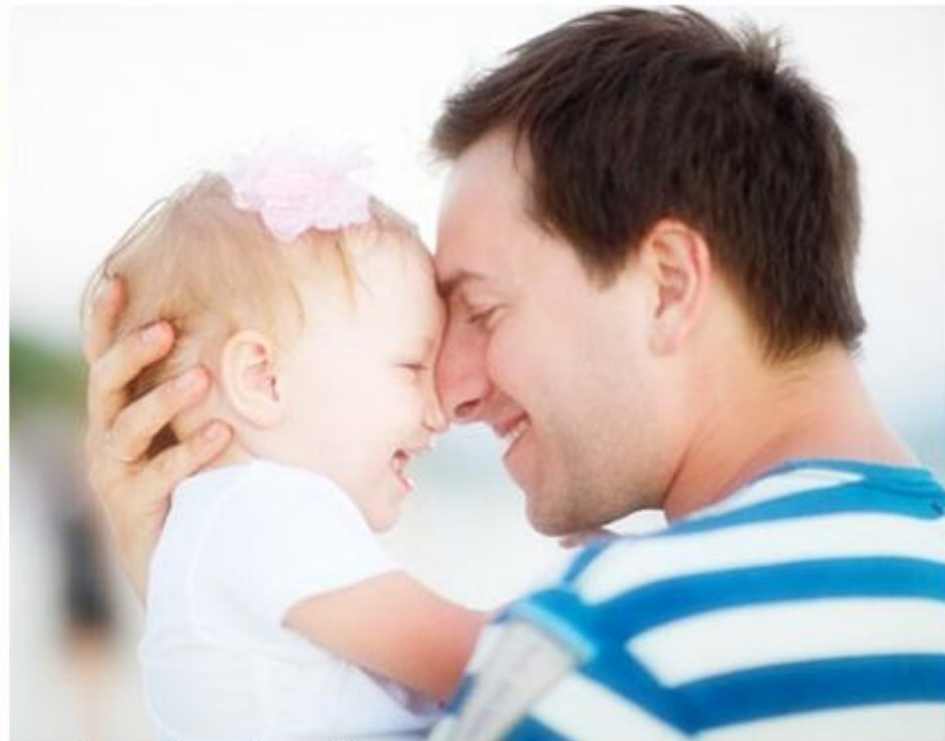
ภาพประกอบข่าวจากอินเทอร์เน็ต

ผอ.ศูนย์เวชศาสตร์อายุรวิวัฒน์นานาชาติ กล่าวด้วยว่า ทั้ง 6 ข้อนี้ขอให้มันเป็นเสมือนจดหมายเปิดผนึกจากคุณลูกถึงคุณพ่อทุกท่าน ซึ่งเป็นสิ่งที่แสดงถึงกตเวทิตาคุณอันเป็นคุณสมบัติของลูกผู้เจริญ และที่สำคัญเหนือไปกว่านั้น ก็คือ เป็นการแสดงว่าพ่ออยู่ในหัวใจลูกเสมอ ไม่ว่าจะอายุเท่าไรหรือไม่ใช้ลูกเล็กๆ ของพ่อแล้วก็ตาม แค่ว่าถามว่าป้านี้คุณพ่อได้ตรวจสุขภาพหรือยัง ถ้ายังลูกจะได้พาไปตรวจ แค่นี้ก็ชื่นใจของคนเป็นพ่อ แล้วสำหรับลูกที่ทำให้พ่อด้วยหัวใจก็จะได้รับความสุขใจอย่างล้นเหลือเข้ามา